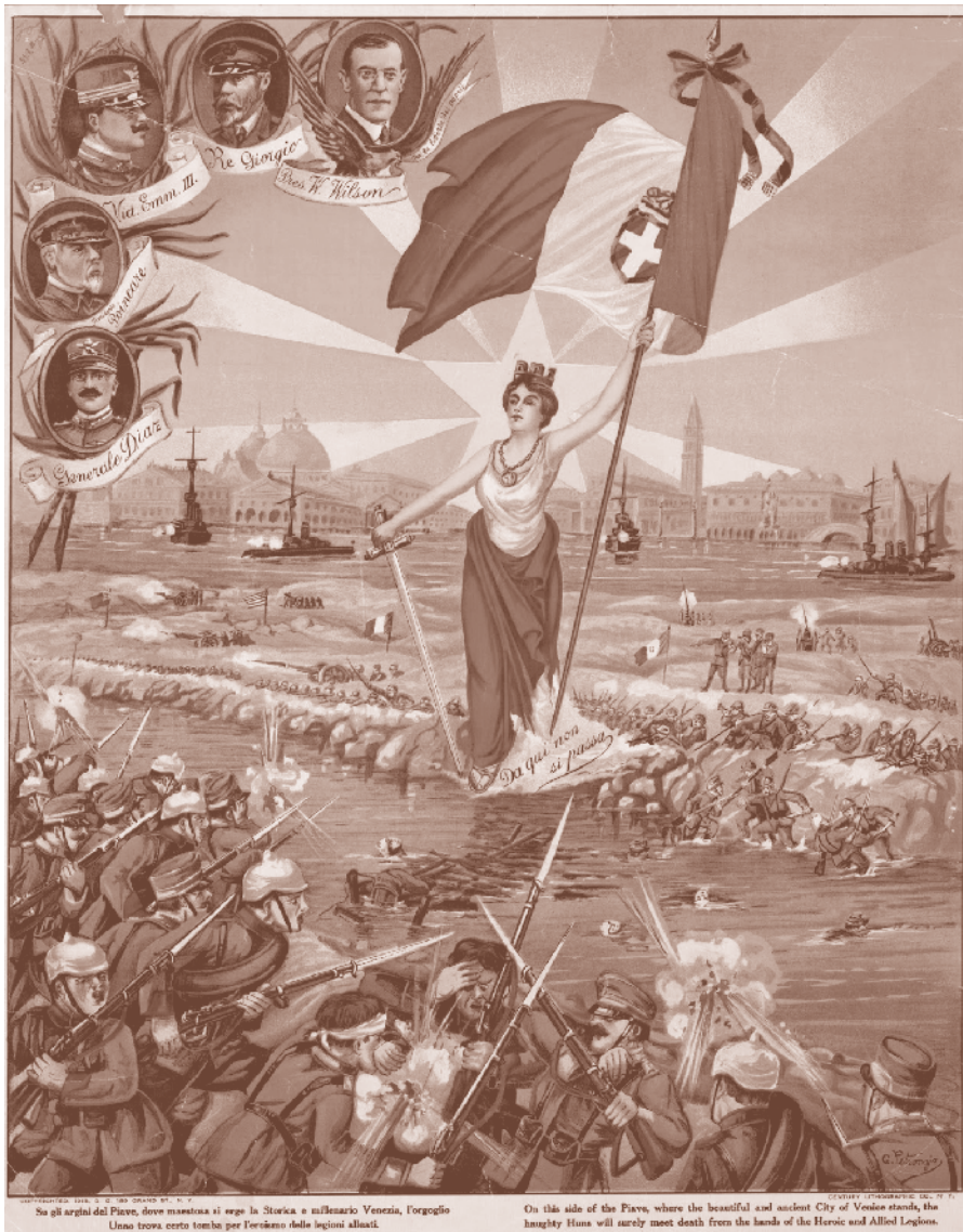
Prima Guerra Mondiale, manifesto di propaganda esaltante la difesa della linea del Piave.