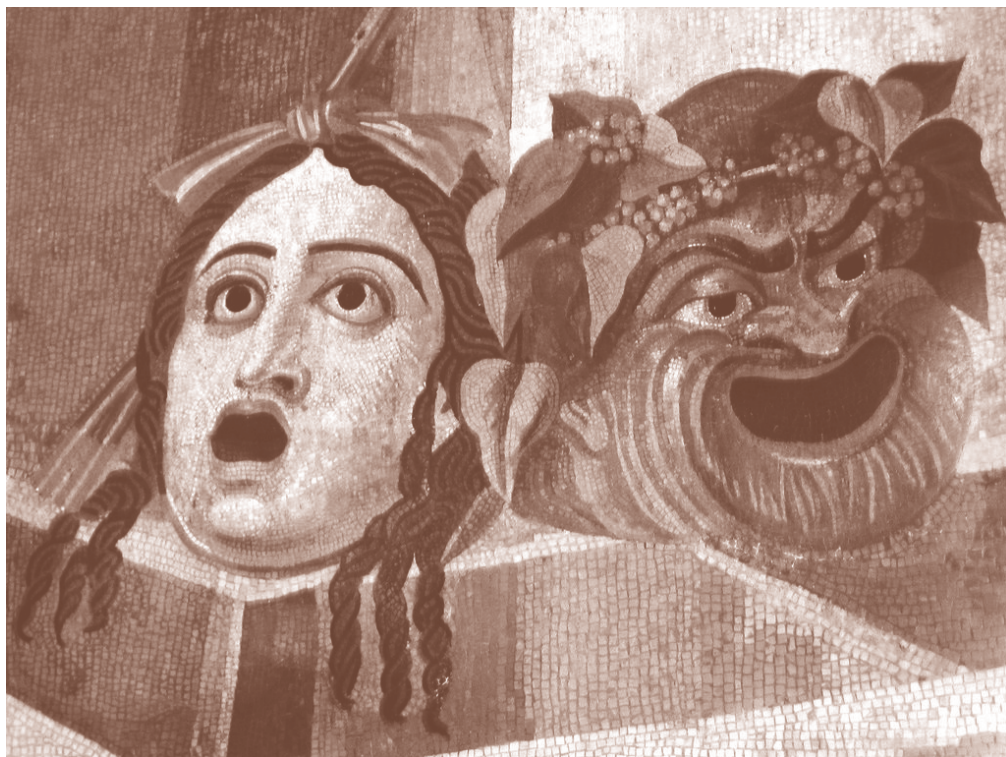
Maschere del teatro antico in dramma e commedia, mosaico romano, II sec, d. C.