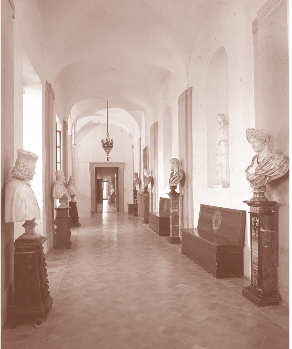
Palazzo Chigi in Ariccia