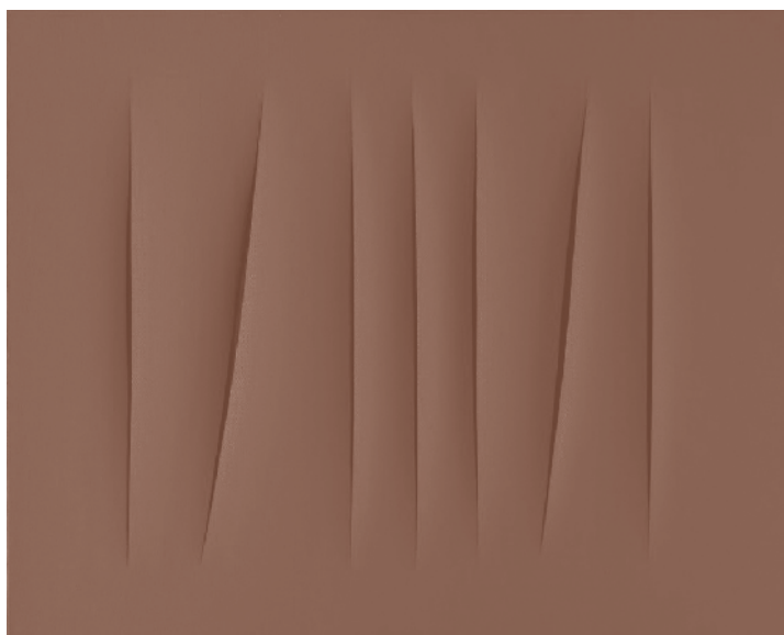
Concetto spaziale - Tagli. Lucio Fontana.

Lo Spazialismo (prima parte): Fontana, Burri, Vedova