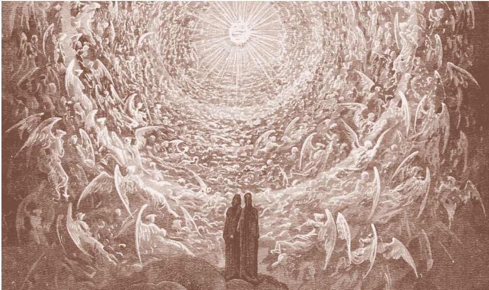
Dante e Beatrice contemplan l'Empireo di Giacomo Traldi, incisione di Gustave Doré.

N.B.: Il corso si terrà su piattaforma Google Meet con inizio alle ore 18:30 e avrà una durata di circa 60 minuti.