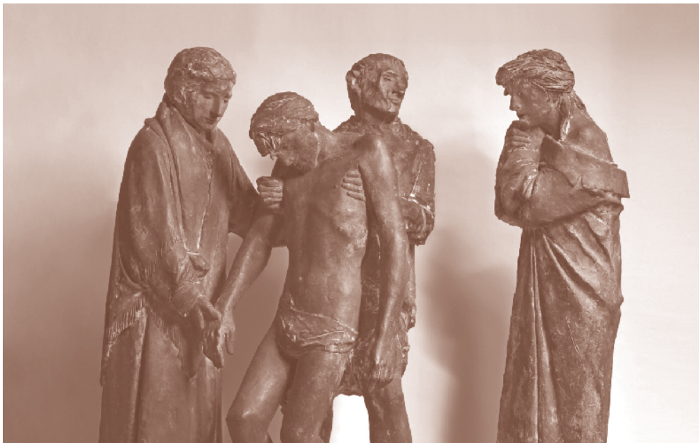
La pietà, Giacomo Manzù.